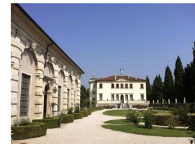
Villa Valmarana ai Nani (Vicenza).