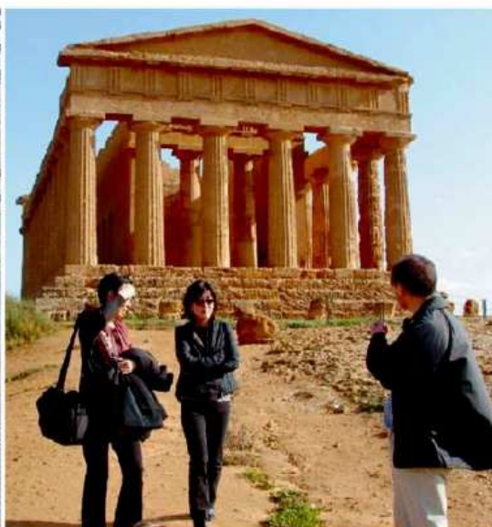
A sinistra, la Villa del Casale di Piazza Armerina: dopo il restauro non ha conosciuto crisi. A destra, la Valle dei Templi ad Agrigento: 50 mila visitatori in meno

CRESCE IL NUMERO DEI BIGLIETTI OMAGGIO. IL CASO DI POLIZZI: SU 1.023 VISITATORI HANNO PAGATO SOLTANTO IN 159