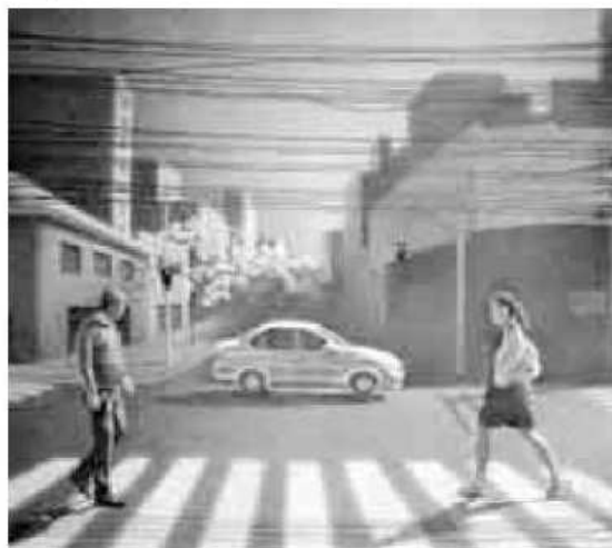
IAN GUPER (SINAL FECHADO. 2013) IN MOSTRA A PALAZZO ZIINO