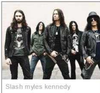
Slash myles kennedy

La sei corde è la protagonista assoluta del Guitar Legends Festival, appuntamento settimanale dedicato alla chitarra che dal 20 ottobre al 15 dicembre porta a Roma nomi noti e giovani promesse della scena internazionale. Il 20 sul palco