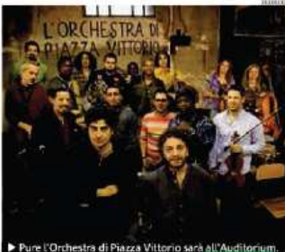
► Pure l'Orchestra di Piazza Vittorio sarà all'Auditorium.

Il progetto si ispira al sistema ideato da José Antonio Abreu, da oltre trent'anni attivo in Venezuela per l'emancipazione di bambini e ragazzi di strada. «Ringrazio tutti per questa iniziativa - sottolinea Abreu - esprimofin d'ora il desiderio di tornare molto presto in Italia per suonare insieme in un grande concerto di fratellanza e di amore che riunisca i giovani ta-